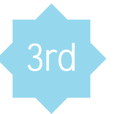
全球集运行业前十大公司市场份额情况 (2019年3月)